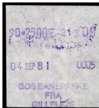
Type Almex Bb

Maskine 5. Normal skriftstørrelse. Gilleleje. 1980.