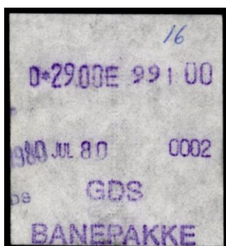
Type Almex A

Maskine 2. Stor skrift. Uden stationsangivelse. 1980. Stemplet Tisvilde.