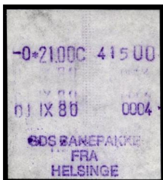
Type Almex Ba

Maskine 4. På udklip af kvitterings-blanket. Trykket lodret forskubbet. Normal skriftstørrelse. Helsinge. 1980.