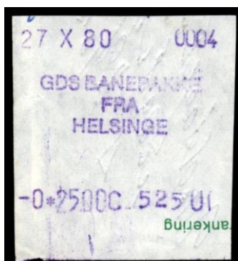
Type Almex Ba påtryk.

Maskine 2. Stor skrift. Uden stationsangivelse. 1980.