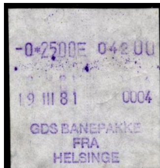
Type Almex Ba

Maskine 4. Normal skriftstørrelse. Helsinge. 1980.