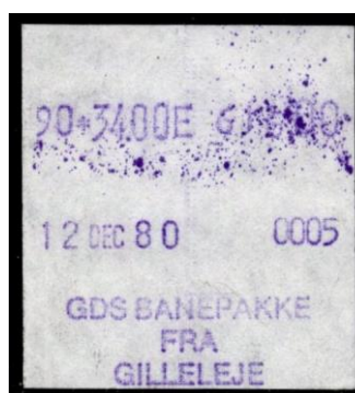
Type Almex Bb

Maskine 4. Normal skriftstørrelse. Helsinge. 1983. Stemplet Helsinge.