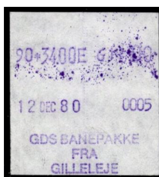
Type Almex Bb

Maskine 4. Normal skriftstørrelse. Helsinge. 1983. Stemplet Helsinge.