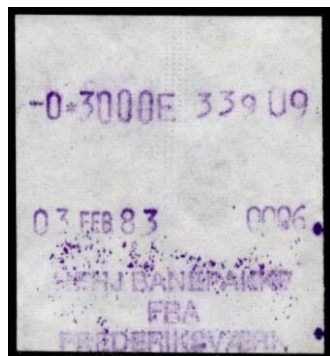
Type Almex C

Maskine 3. På udklip af kvitterings-blanket. Fra Hundested. 1981.