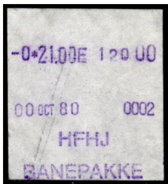
Type Almex A