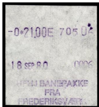
Type Almex C

Maskine 1. Uden stationsangivelse. 1981. Stemplet Skævinge