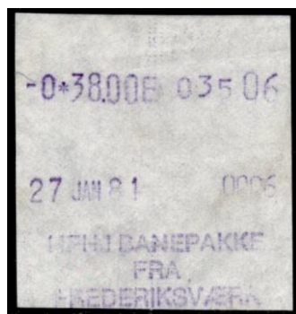
Type Almex C