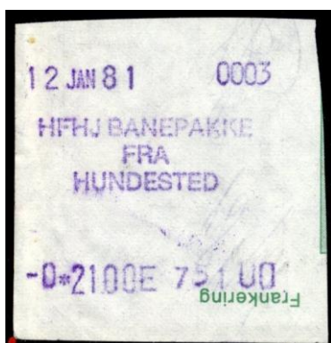
Type Almex B Påtryk

Maskine 3. På udklip af kvitterings-blanket. Fra Hundested. 1981.