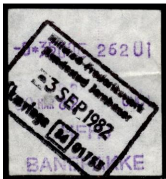
Type Almex A

Maskine 1. Uden stationsangivelse. 1982. Stemplet Skævinge.