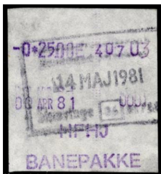
Type Almex A

Maskine 1. Uden stationsangivelse. 1981. Stemplet Skævinge