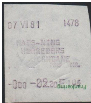
Type Almex A påtryk.

Maskine 1476. På udklip af kvitte- rings-blanket. 1978.