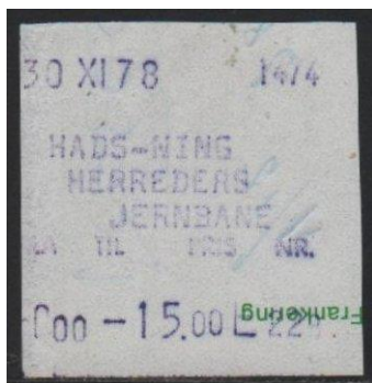
Type Almex A påtryk.

Maskine 1474. På udklip af kvitte- rings-blanket. 1978.