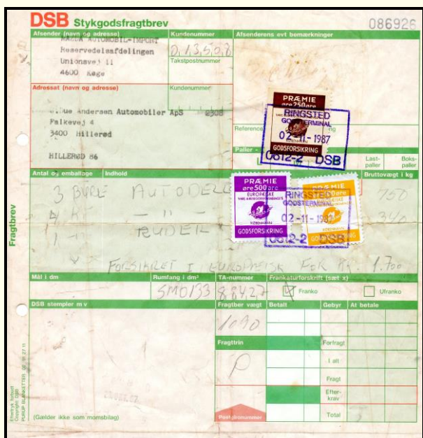
Godsforsikringsmærker på DSB stykgodsfragt. (Gælder ikke som møjsøbing)

I 1966 fandtes følgende værdier: 25, 50, 75, 100 (gul), 250 (brun), 300, 500 (violet) øre samt 10 kr. I tidens løb har der været flere værdier i visse perioder. Relativt sent således også mærker på 25 kr. og 50 kr.