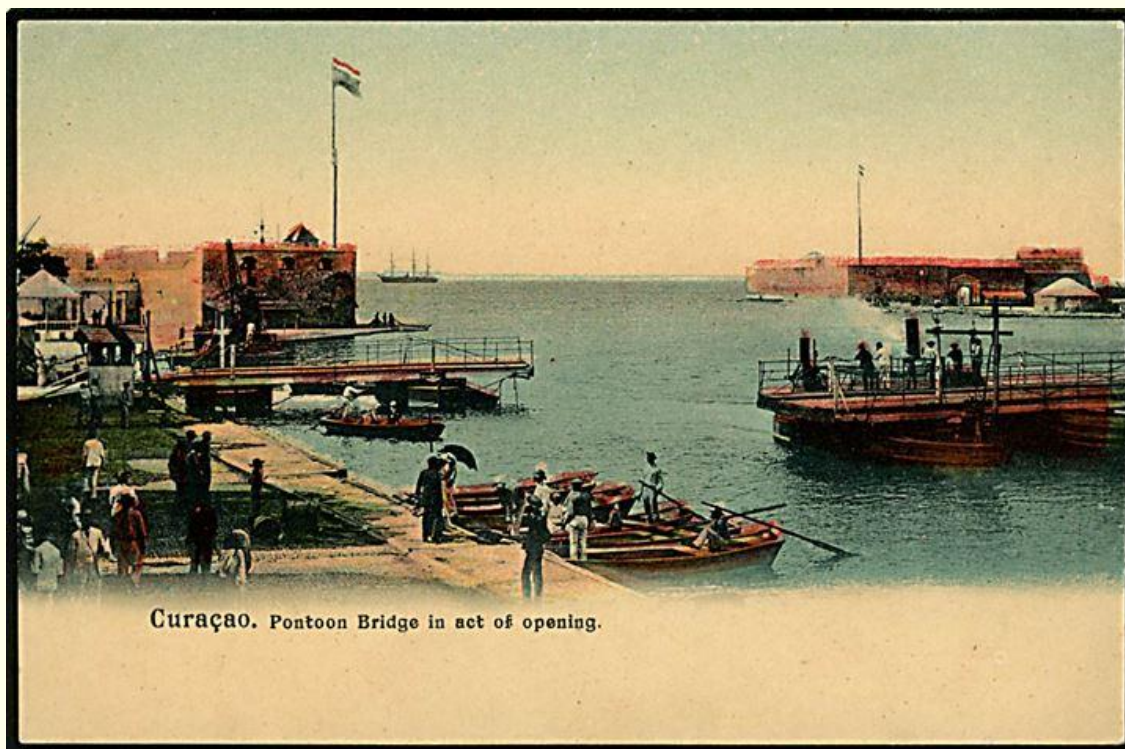
Postkort af brien dateret 24-1-1908. Broen er dampdrevet. Broen blev opført i 1888.