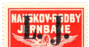
Type Af, nr. 45d

Udsnit i 1:1. Opbrugsudgave fra Nakskov – Rødby Jernbane, mærket er overtrykt L. J. Lang, tynd spids på tv. foden af L. Pos. 11-12, 15.