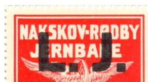
Type Af, nr. 45e

Udsnit i 1:1. Opbrugsudgave fra Nakskov – Rødby Jernbane, mærket er overtrykt L. J. Manglende fane tv. på toppen af L. Pos. 14.