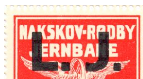
Type Af, nr. 45g

Udsnit i 1:1. Opbrugsudgave fra Nakskov – Rødby Jernbane, mærket er overtrykt L. J. Variant med punkt langt fra L på overtrykket. Pos. 17.