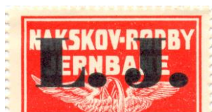
Type Af, nr. 45a

NB! Nederste overtrykslinje i arkene (pos. 21-25) er meget ringe trykt. F.eks. kan type i kan også forekomme i pos. 25.