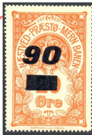
Nummer 21f og 21af 90 på 20 Øre.

1920. Provisorier. Gråhvidt papir. (Sort bogtrykt overtryk)