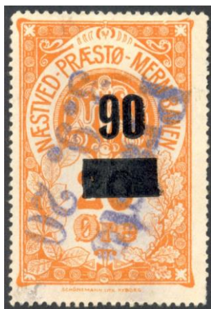
Nummer 21a og 21aa Tykt 0. 90 på 20 Øre.

Alle billeder, billedtekster og tekster til nr. 21a-21f og nr. 21aa-21af slettes og nedenstående tilføjes: