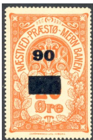
Nummer 21c og 21ac 90 på 20 Øre.