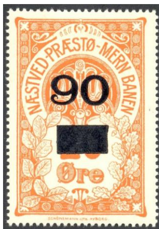
Nummer 21b og 21ab 90 på 20 Øre.