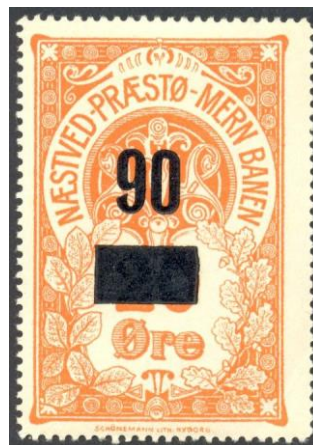
Nummer 21d og 21ad Smalt 0. 90 på 20 Øre.