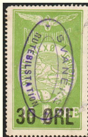
Violet ovalt stempel på Den Bornholmske Jernbane nr. 3. (DBJ): SVANEKE RUTEBILSTATION