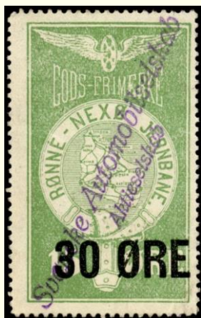
Violet linje stempel på Den Bornholmske Jernbane nr. 3. (DBJ): Svaneke Automobilselskab. Aktieselskab

I 1947 købte man en ny ejendom på Torvet (i dag Restaurant Bryghuset), også med ekspeditionslokale, venterum og pakkerum, samt garage til to rutebiler. Stationen fortsatte til sep. 1968, hvor banen lukkede. Der var ansat bydreng til pakke-udbringning i byen.