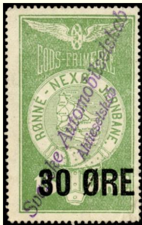
Violet linje stempel på Den Bornholmske Jernbane nr. 3. (DBJ): Svaneke Automobilselskab. Aktieselskab

I 1947 købte man en ny ejendom på Torvet (i dag Restaurant Bryghuset), også med ekspeditionslokale, venterum og pakkerum, samt garage til to rutebiler. Stationen fortsatte til sep. 1968, hvor banen lukkede. Der var ansat bydreng til pakke-udbringning i byen.