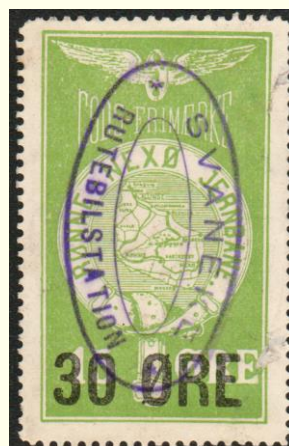
Violet ovalt stempel på Den Bornholmske Jernbane nr. 3. (DBJ): SVANEKE RUTEBILSTATION