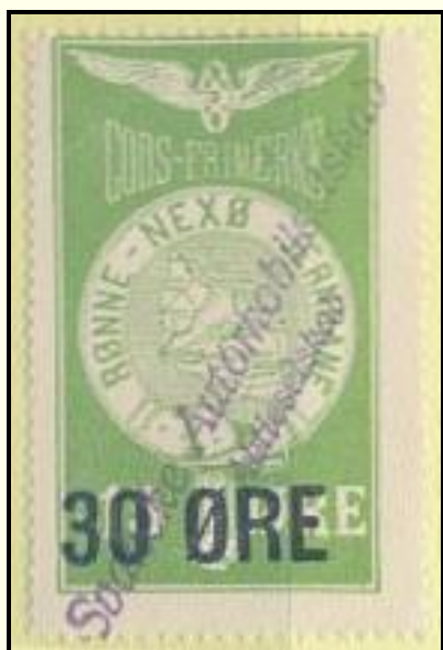
Violet linje stempel på Den Bornholmske Jernbane nr. 3. (DBJ): Svaneke Automobilselskab. Dobbelt stempel.

I 1947 købte man en ny ejendom på Torvet (i dag Restaurant Bryghuset), også med ekspeditionslokale, venterum og pakkerum, samt garage til to rutebiler. Stationen fortsatte til sep. 1968, hvor banen lukkede. Der var ansat bydreng til pakke-udbringning i byen.