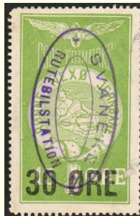
Violet ovalt stempel på Den Bornholmske Jernbane nr. 3. (DBJ): SVANEKE RUTEBILSTATION