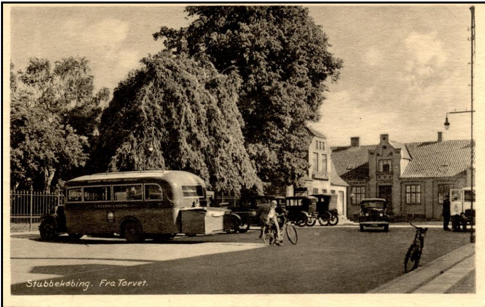
Rutebil på torvet i Stubbekøbing