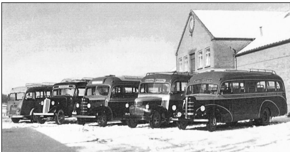
De fem grønne rutebiler fra 1955.