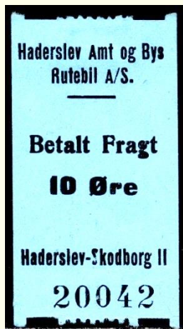
Type C Haderslev - Skodborg II