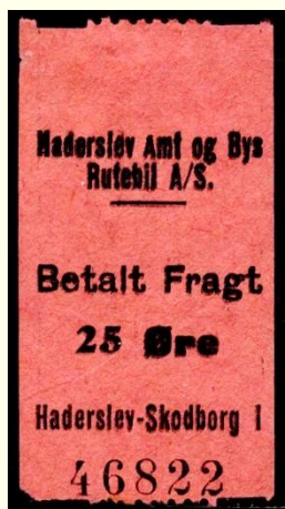
Type B Haderslev - Skodborg I