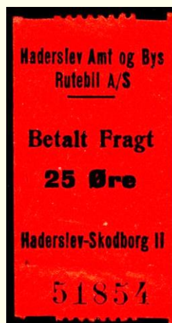
Type E Haderslev - Skodborg II A/S i selskabsnavn uden efterfølgende punktum ellers som type C