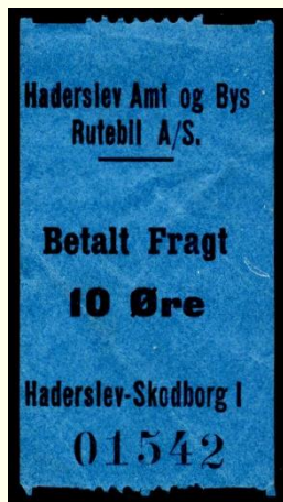
Type A Haderslev - Skodborg I