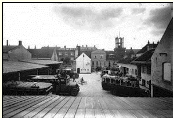
Rutebilstationen på Dæmningen.

d. 13. august 1941 og var i drift til 1999, hvor den blev en del af trafikcentret ved den nye banegård.