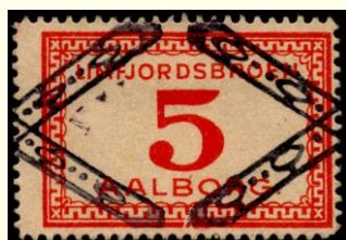
Lille kryds fra ark. (her inkl. en omvendt ramme).

Det har derfor været nødvendigt at indføre tre prisklasser ud for hver billet.