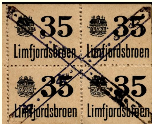
Stort kryds fra hæfte.

Store kryds i hæfte: Armbredde ca. 5,5 mm.