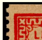
Sidste streg i mæanderbort inden x går opad. Udsnit 1:2.