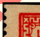
Sidste streg i mæanderbort inden x går nedad.

Se hjørnet øverst til venstre og omvendt \Delta under B i Aalborg. Ellers som Type Da.